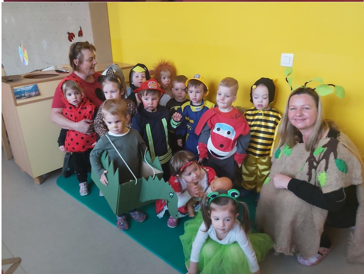
Zapisała Anica Metelko z Nado Poredoš