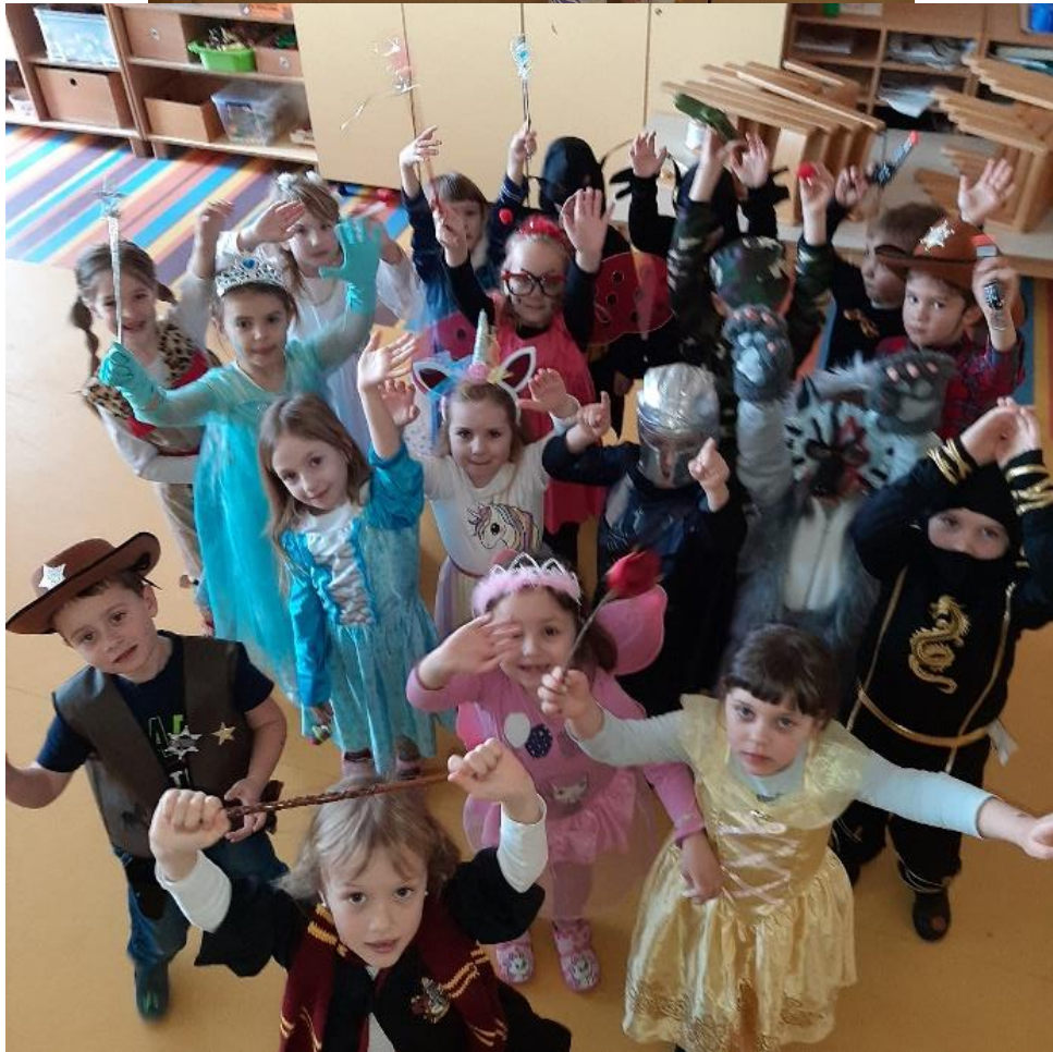
Zapisala: Kaja Vukšinič