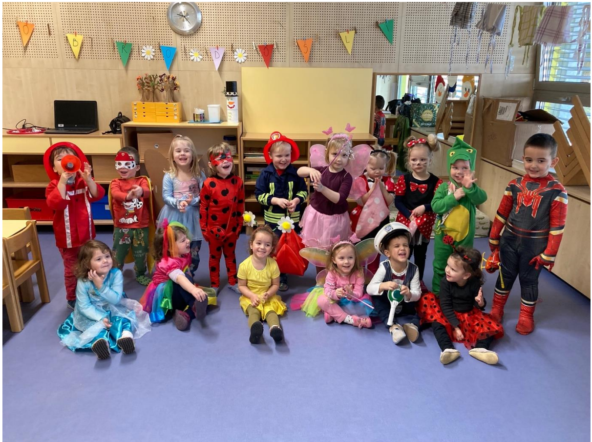
Zapisala: Katarina Tratar